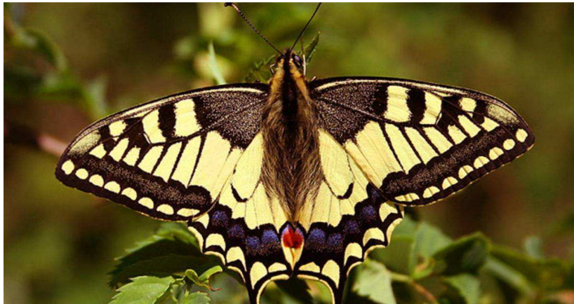
Figuur 1 Koninginnenpage (Papilio machaon) op de tuin gespot door tuinders